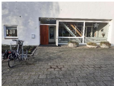
Beneden-ingang van de kerk