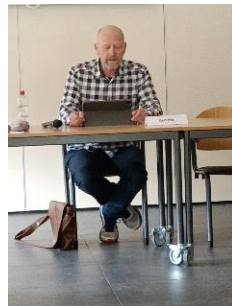
Afscheid nemende 3 e -jaars cursist houdt toespraak namens alle 3 e -jaars