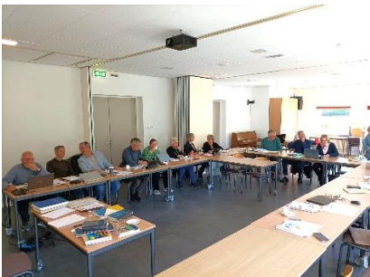
Een beeld van de cursuszaal in de Paaskerk