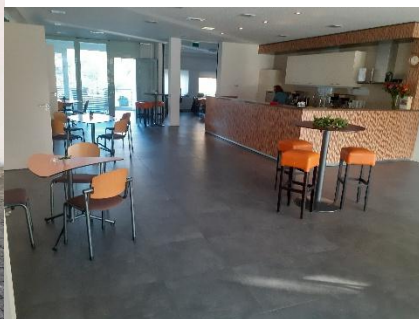
De hal beneden met zitjes