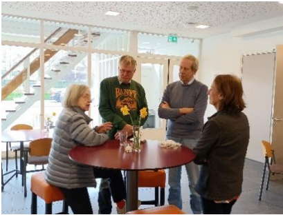
Pauze tussen de twee lessen

daglicht te staan of werd eindelijk beantwoord met als bijkomstigheid dat dat weer nieuwe vragen oproep. Dat hinderde mij niet in het minst; het was mij welkom. Ook van de verrassende inzichten van mijn medecursisten heb ik onvermoed vaak veel opgestoken. Rijk en overvloedig beschouw ik dus de oogst die ik van hier meeneem en dat stemt mij dankbaar en tevreden. Met een ervaring als deze durf ik daarom zonder meer te beweren, dat wie een cursus theologie zoekt, en daaraan over de volle breedte stevige kwaliteitseisen stelt, bij deze TVG aan het juiste adres is'.