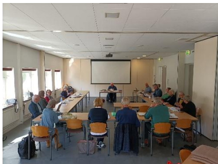
Een beeld van de cursuszaal