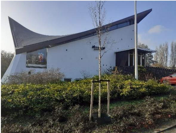
Paaskerk in Amstelveen

Meer informatie over het TVG aanbod elders - we werken namelijk samen met andere TVG cursussen - kun je vinden op de landelijke website van TVG's: www.tvg-algemeen.nl